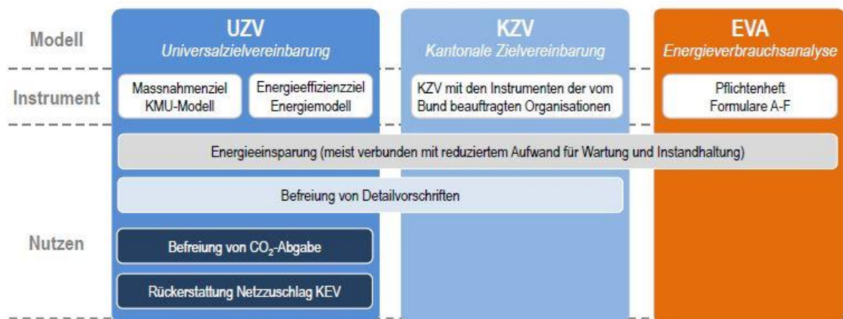
Darstellung 2 - Synergien der Umsetzungsvarianten